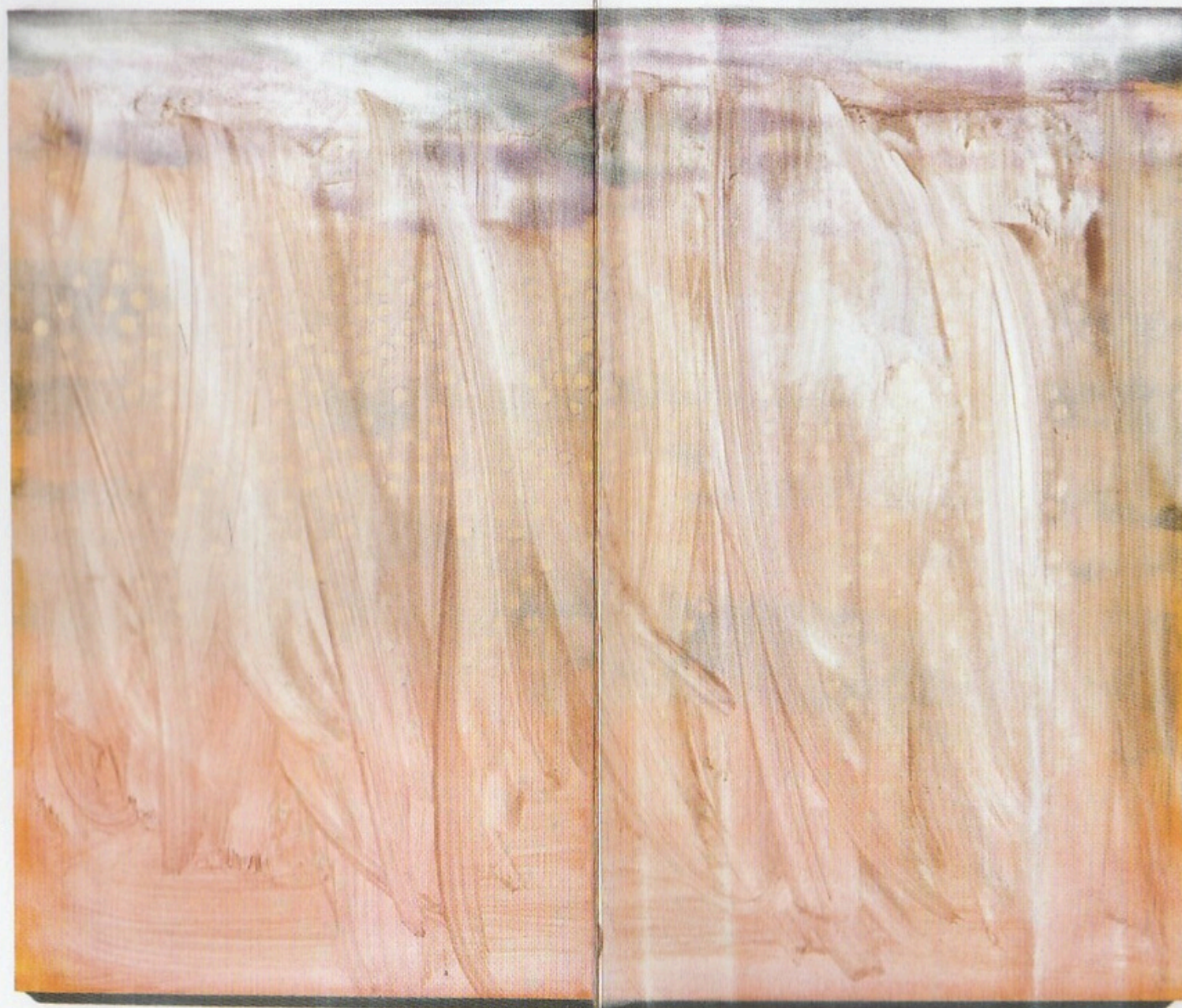
Fortuna / Fortune, 2008/2009.