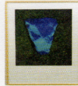
Carlos Pasquetti / 1948, Bento Gonçalves-RS-Brasil. Energizadores de Parede, 1996. Polaroides (detalhe). 320 x 94 cm