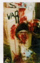
Mara Alvares / 1950, Porto Alegre-RS-Brasil. Da Série Pinturas Urgentes: War, 2003. Plotagem. 58 x 78 cm