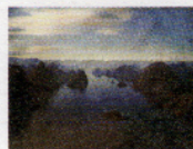
Joan Fontcuberta / 1955, Barcelona-Espanha. Orogenesis: Mano, 2003. Cibachrome. 123 x 83 cm