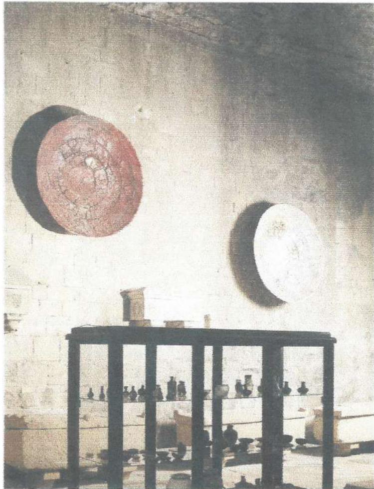
"Me ofrece una" Vista de la instal·lació