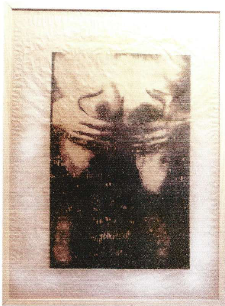
Begoña Egurbide - 4 a 31 de Março de 1996