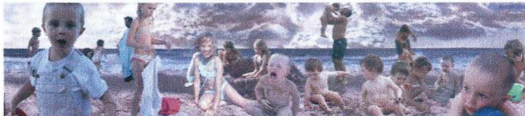
Posició 1, 2 i 3: Mostres de 3D i flip segons la posició i moviment de l'espectador.