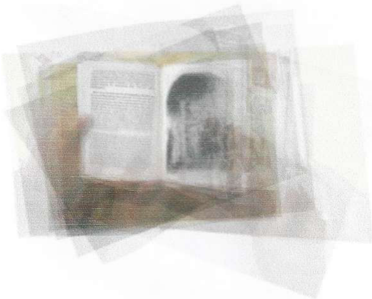
Reading About Looking at Pictures in a Book 2 (after David Hockney) Photography 2003