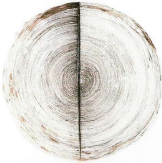
Capoiera 2 Mud and waste oil on paper, 83 x 93 cm 1993