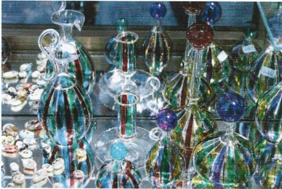
Fotografias, Galeria Gestual, Porto Alegre, 2002