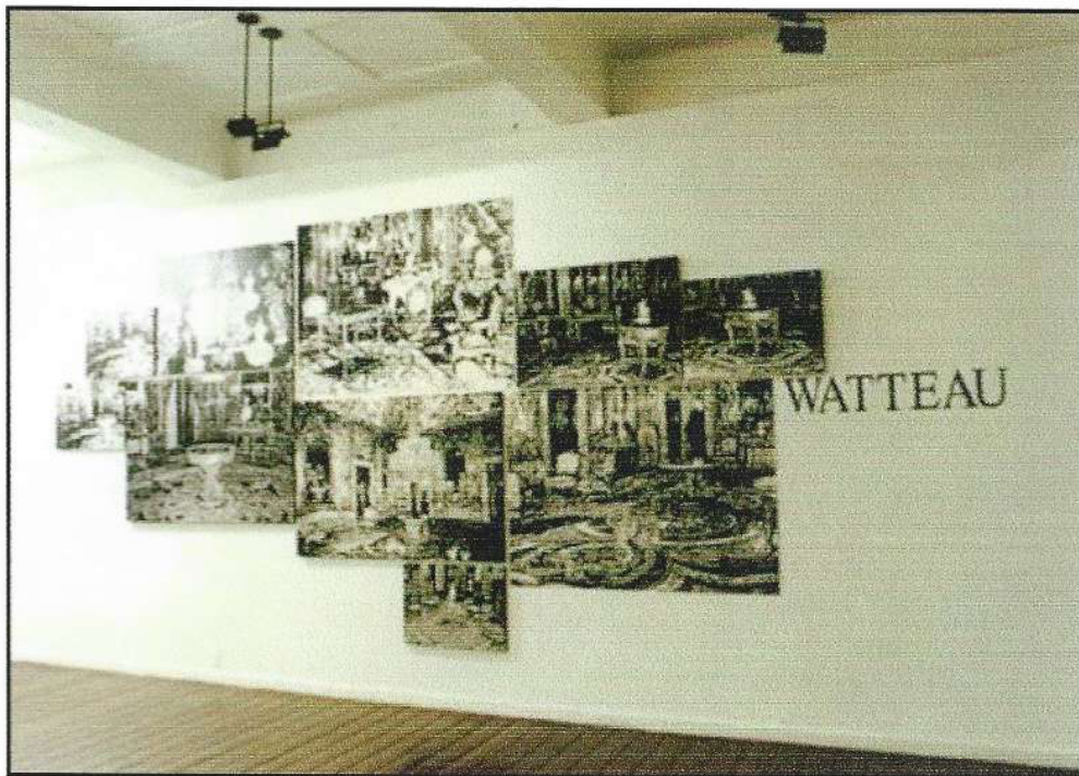
Watteau, instalação de pinturas, MAC-RS, Porto Alegre, 1999