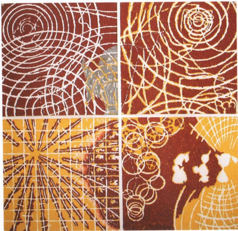
"Sem título" número 13, desenho sobre papel, 2000/2001, 210 X 210 cm

Os "Desenhos Simples" são um conjunto de trabalhos executados entre 2000 e 2004 e que tem por característica o uso de um plano estabelecido por uma estrutura e rede, limitada ao quadrado ou ao retângulo. O espaço estabelece limites definidos e diferentes dos "Desenhos Instalações", executados anteriormente, onde o ritmo interno de um suposto centro estabelecia e irradiava os elementos para o "espaço amplo". Diferente também dos "Planos e Idéias", dos idos anos 70, onde o espaço constituído projetava através do desenho um futuro de uma concepção de algo, real ou hipotético. Executados sobre papel (sem a complexidade de outros elementos, os "Desenhos Simples" são caracterizados por sua escala e sua materialidade originada no uso de materiais denso como o óleo e outros, construindo com o positivo e negativo os elementos constitutivos deste espaço. Na real, os "Desenhos Simples" são o que são, e dizem o que tem que dizer!!!