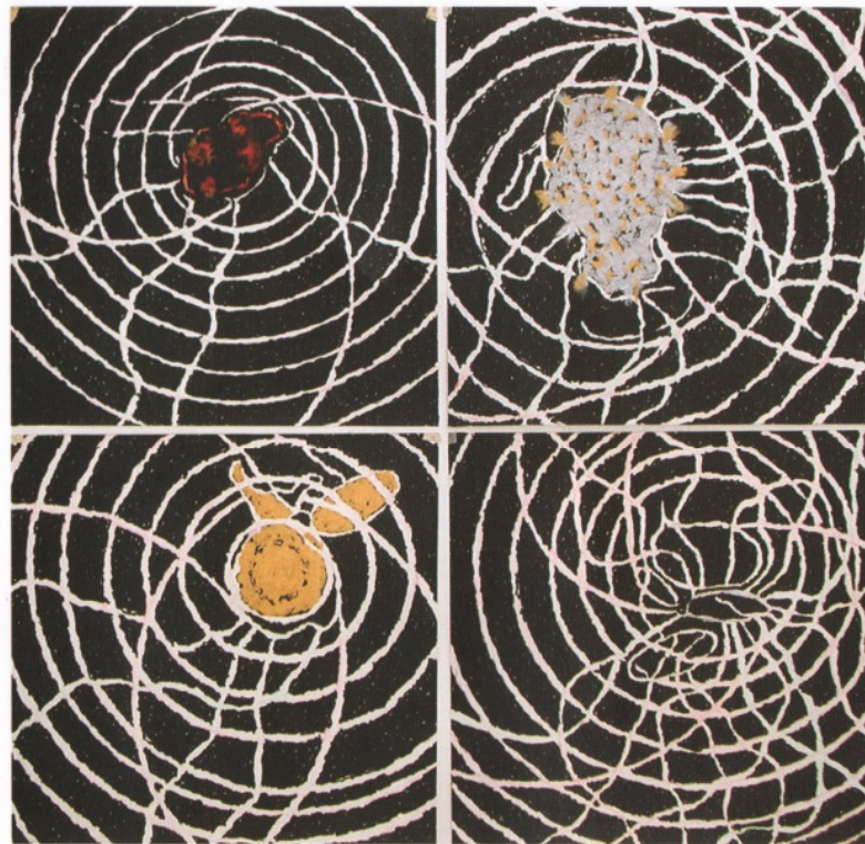
"Sem título" número 12, desenho sobre papel, 2002/2003, 210 X 210 cm